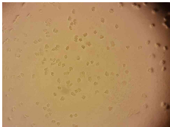
شکل 1- کیست چندضلعی جنس آکانتاموبا در محیط کشت آگار غیر مغذی غنی شده با اشرشیا کلی