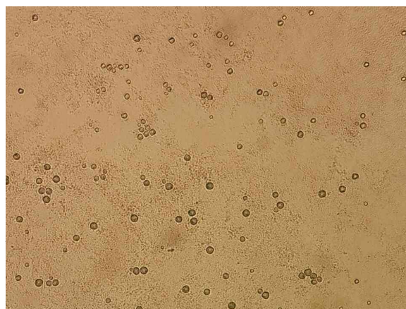
شکل 2- تروفوزوئیت های جنس آکانتاموبا در محیط کشت آگار غیر مغذی غنی شده با اشرشیا کلی